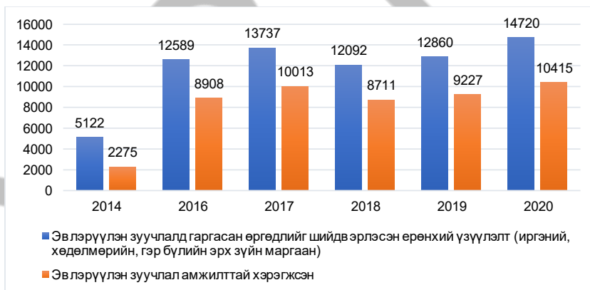
Хүснэгт 6. Эвлэрүүлэн зуучлах ажиллагааны хэрэгжилт 25

Эвлэрүүлэн зуучлалын тухай хуулийг 2002 онд баталж, 2013 оны 07 дугаар сарын 01-ний өдрөөс мөрдсөн бөгөөд иргэний хэргийн анхан шатны бүх шүүхэд орон тооны эвлэрүүлэн зуучлагч ажиллаж, хэрэг маргааныг хянан шийдвэрлэх шинэ аргыг нэвтрүүлсэн юм. Үүнээс хойш эвлэрүүлэн зуучлалд гаргасан өргөдлийг шийдвэрлэсэн үзүүлэлтийг Хүснэгт 5, 6-аас үзнэ үү.