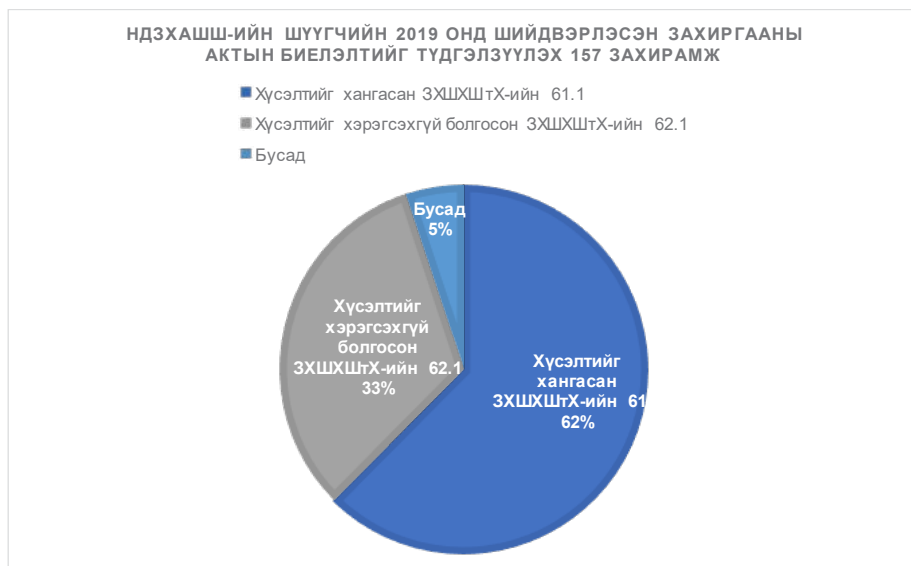
График 1. НДЗХАШШ-ийн шүүгчийн 2019 онд шийдвэрлэсэн захиргааны актын биелэлтийг түдгэлзүүлэх 157 захирамж